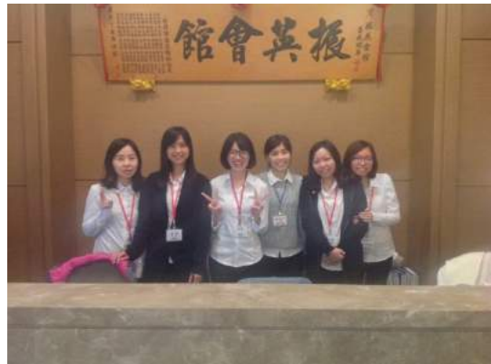
振英会館の女性スタッフ6人の方々