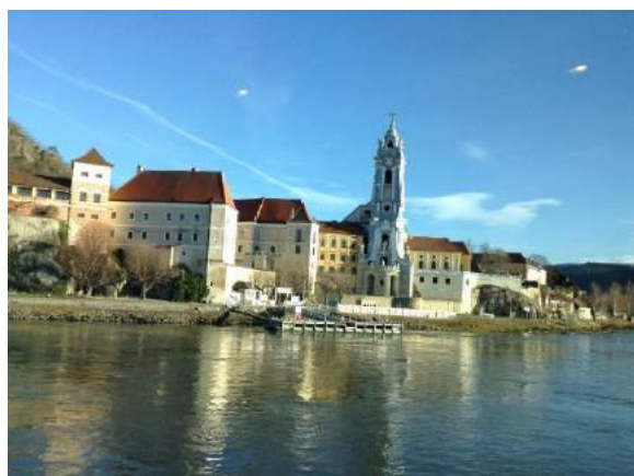
ドナウ川クルーズ・船窓からの眺め

「光輝くドナウ川クルーズで過ごすクリスマスの旅」と銘打ったツアーに参加した。今までは10万トンを超える大型船でのクルージングを楽しんできたが川クルージングは初めてである。船は川クルージング専用のアマデウス・シルバーⅡ号。2017年12月21日～29日のクリスマスの旅である。