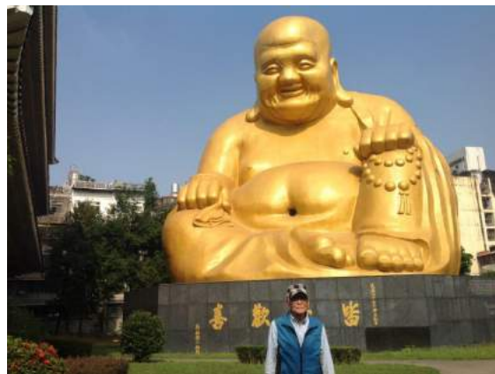
大仏の前で記念写真を撮る筆者

台湾なのに日本にゆかりのある不思議なお寺様です。本堂の奥に進むとこの金色の大仏様にお会いできるのですが、日本と違って布袋様の姿でありニコニコ笑っているのがなんとも「七福神」の「布袋様」です。厳かさはありませんが、しかしなんとも楽しくなる大仏です。