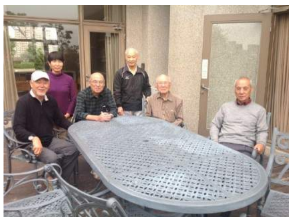
振英会館でのお仲間達

その結果毎朝9時半ごろから談話室に集まり始め新しい方々との知り合いが増え、情報交換や雑談をする事で親睦を深めることが出来ました。こうした事で分かったことは殆どの方がこの会館に5年～10年間来ているリピーターでした。彼らの情報は私の様な台中のビギナーにとっては大変便利で手取り早い情報入手とこの地での色々なノウハウを知る方法としてベストな物でした。