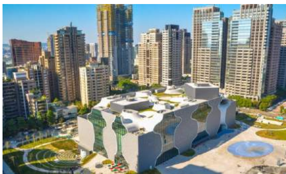
台中国家歌劇院の外観

日本人で世界的建築家である伊東豊雄氏が設計し、完成自体が奇跡！「世界で最も建築が難しい建物」といわれ 11 年の歳月かけて完成したというこのオペラハウス、ユニークな外観を初めて掲載した日本の新聞を見てびっくりしました。巨大なオブジェの様です。