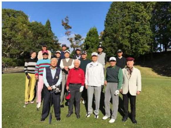
第3回リタメン会ゴルフコンペ・参加者集合写真