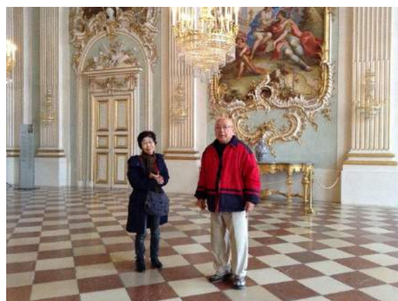
ニンフェンブルグ城の広間にて 筆者と奥様のスナップ写真

街のはずれにあるヴィッテルスバッハ家の夏の離宮ニンフェンブルグ城を訪ねた。「妖精の城」を意味するバロック様式の宮殿である。祝祭大ホール、謁見の間、寝室、36人の美人画を飾った部屋等を鑑賞した。