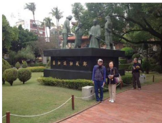
「鄭成功を奉った寺」内を 散策される 筆者ご夫妻

こうしたバックグラウンドを持った歴史的建造物「鄭成功を奉った寺」等を見て回りました。