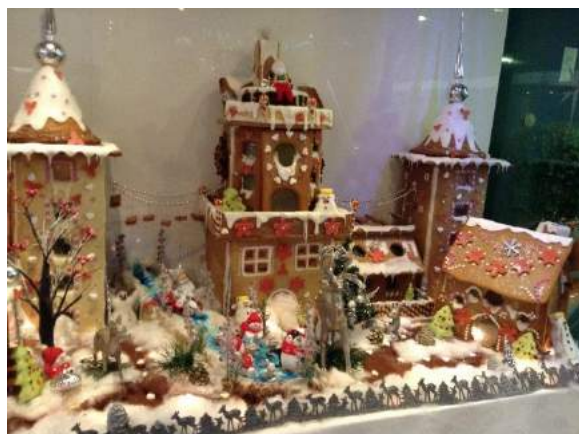
船内のデコレーションケーキ