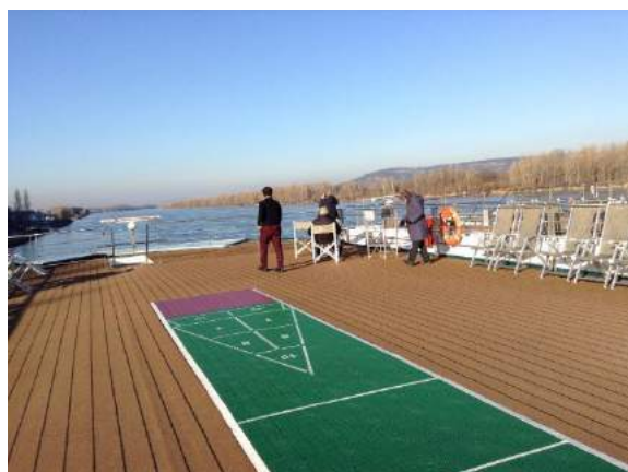
ドナウ川クルーズ・船尾からの景色

*空路：成田→フランクフルト→ミュンヘン *クルーズ：往路と復路は同じルート 停泊地は下記の通り。 （往路）パッサウ（ドイツ）→リンツ（オーストリ