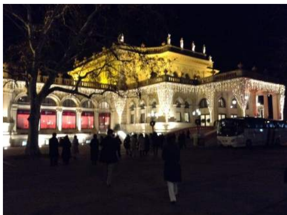
クリスマスディナーとコンサート会場。

ここでもクリスマス市巡り、ザッハー通り、ケルトナー通りで買い物、カフェでゆっくりする人もいた。